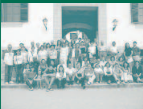
L'ÈXIT DE LES I JORNADES D'ESTUDIS LOCALS

Malgrat la preocupació dels organitzadors, per ser la primera experiència en aquest tipus d'activitat i sobretot per la seva coincidència amb la celebració de l'Acampallengua al poble, les I Jornades d'Estudis Locals d'Esportes obtingueren un gran èxit de participació durant tot el cap de setmana. Foren al voltant de 80 persones les que assistiren a escoltar les comunicacions i realitzaren la visita a Canet. Esperam superar-ho d'aquí a dos anys.