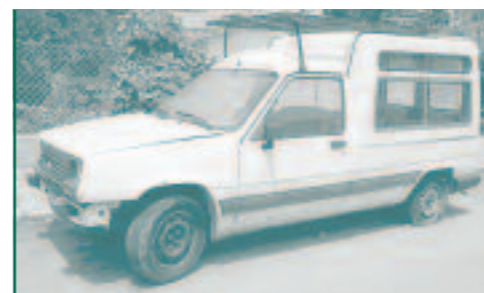
ELS COTXES ABANDONATS