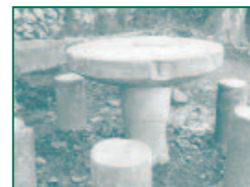
Taula de sa font de Son Tries de d'Alt