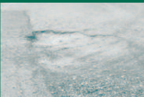
ELS CLOTS QUE HI HA PER TOT ARREU

No és d'estranyar que cada cop hi hagi més gent que opti pels vehicles tot terreny. No és que vagin a fer voltes pels camins de muntanya, deu ser que circulen pel poble i han decidit comprar un cotxe apte per la quantitat de clots que hi ha pels carrers d'Esportes. Hi ha qui dóna la culpa als camions o les feixugues màquines que van d'obra en obra, però els qui pateixen els sotrats són els cotxets de la resta de ciutadans. Algú se n'hauria de fer càrrec.