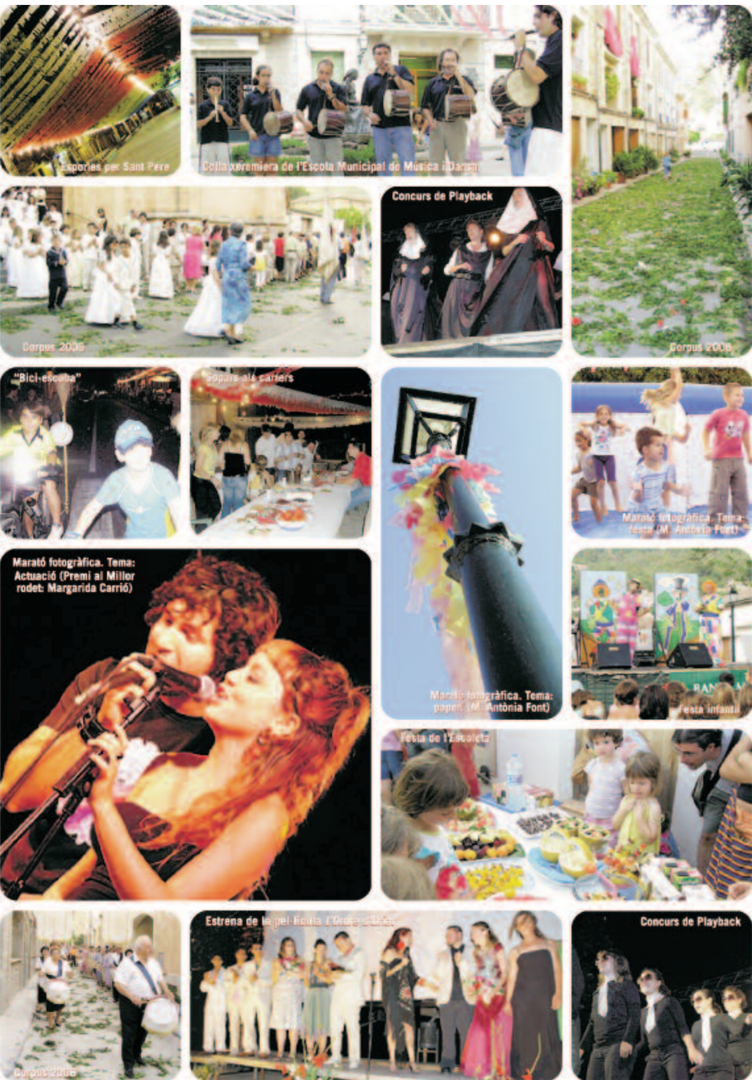
Esportes per Sant Pere

(Els articles publicats a aquesta revista expressen únicament l'opinió dels seus autors.)