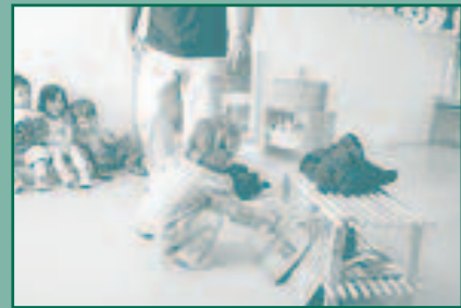
Cada cosa al seu contenidor

Avui han après el que li pertoca a cada contenidor, amb una novetat, hi havia un contenidor marró que tenia molta gana i menjava matèria orgànica!