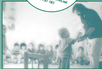
Un "jovenet" reciclant piles!