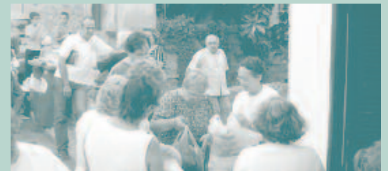
Reunió informativa al Carrer Major