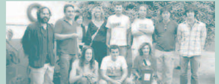
Els becaris i voluntaris Pap

Esporles cada dia serà una miqueta millor gràcies a la feina de tots i totes.