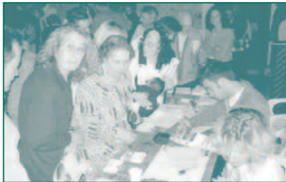
Reunió informativa de la recollida selectiva

Durant aquest any s'han anat fent reunions emmarcades en el procés d'Agenda Local 21, amb els diferents col·lectius professionals i de veïnats d'Esporles, i s'Esgleietta era un dels llocs que restava per convocar.