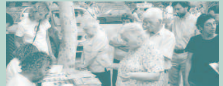
Reunió informativa a la Plaça Balanguera