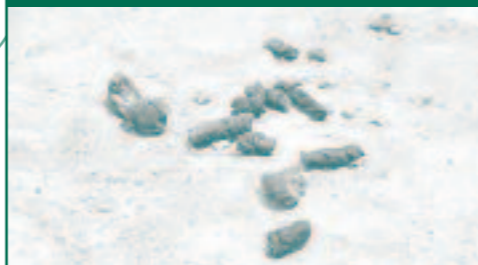
ELS EXCREMENTS DE CA ALS CARRERS