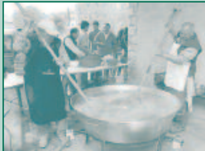
El gran calderó d'arròs brut

L'Ajuntament va organitzar el passat dia 28 d'abril una excursió a Lluc amb la Gent Gran del poble. Un total de 250 persones anaren a gaudir d'una diada emmarcada en el procés d'Agenda Local 21 del municipi. Un altre dels objectius de la sortida era informar a aquest sector de la població del funcionament i de les properes passes a seguir per la posada en marxa de la recollida selectiva porta a porta de matèria orgànica.