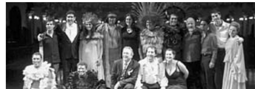
El protagonista brindant, adalt. A baix, posant amb el resta de la companyia