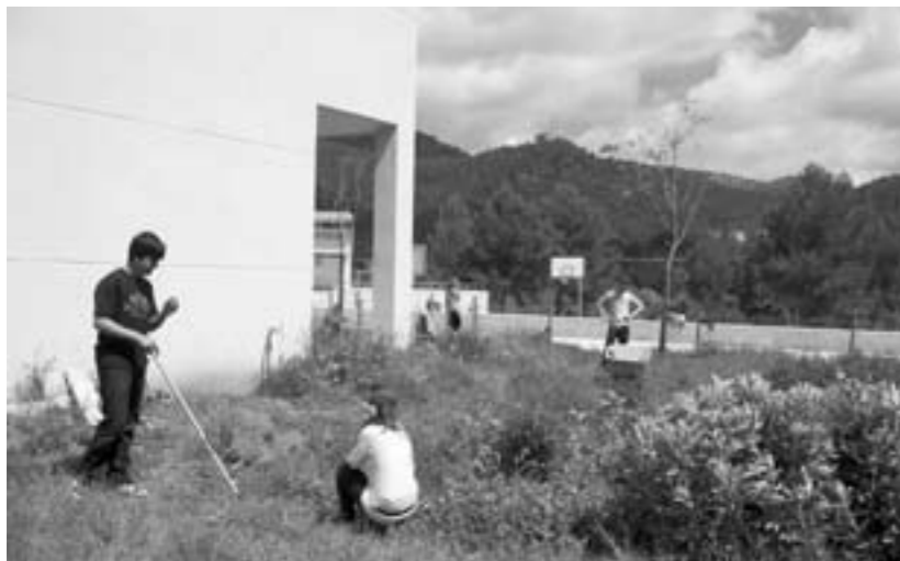
Diversos estudiants realitzant tasques de jardineria