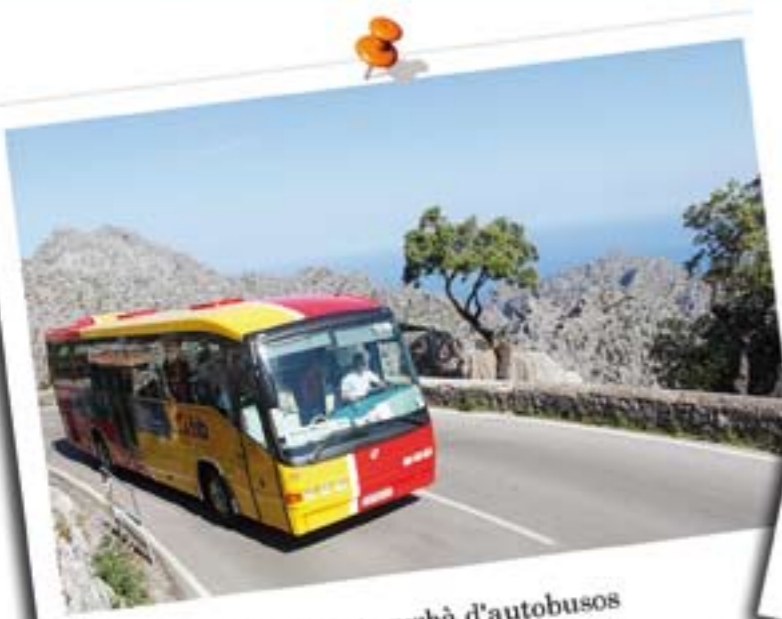
Servei interurbà d'autobusos