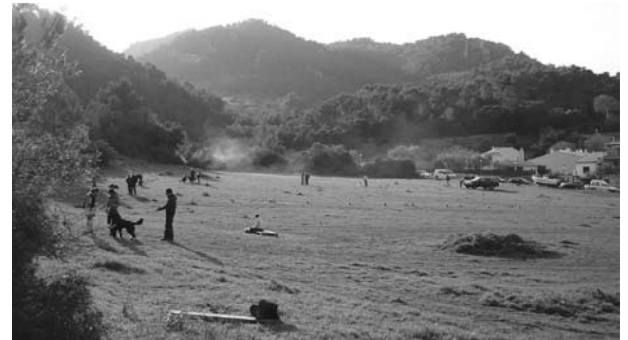
els participants al curs fent pràctiques