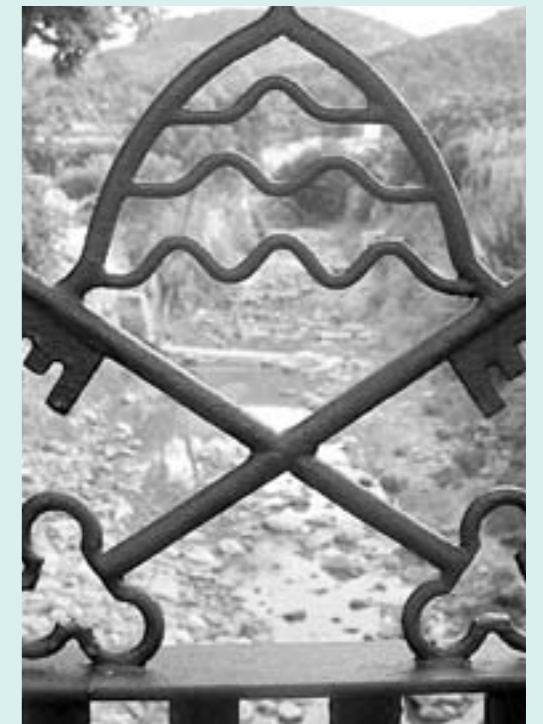
Preciosa vista del torrent

També donam constància, com hem vist amb les nostres caminades per aquesta vall, de que moltes de les fonts que s'havien eixugat o duien poca aigua enguany han tornat a rajar com a temps enrere.