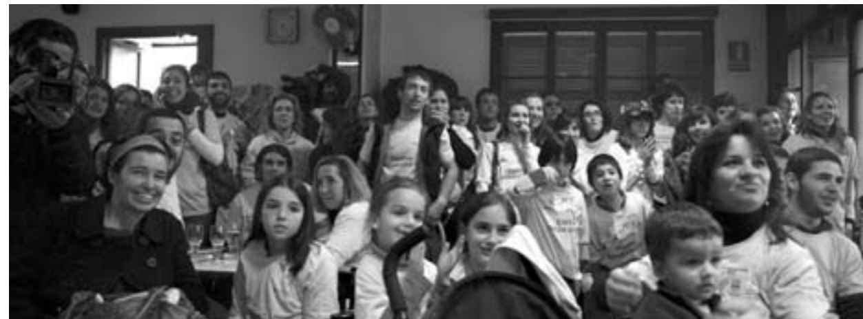
Aspecte dels seguidors que es reuniren al Cafè Nou per veure la prova.

precisament això es el que hem après de tu durant tots aquests anys, que malgrat les dificultats, SEMPRE hem de seguir endavant! En nom meu, en nom del poble, com a Batle i com a Miquel. UNA FORTA ABRAÇADA.