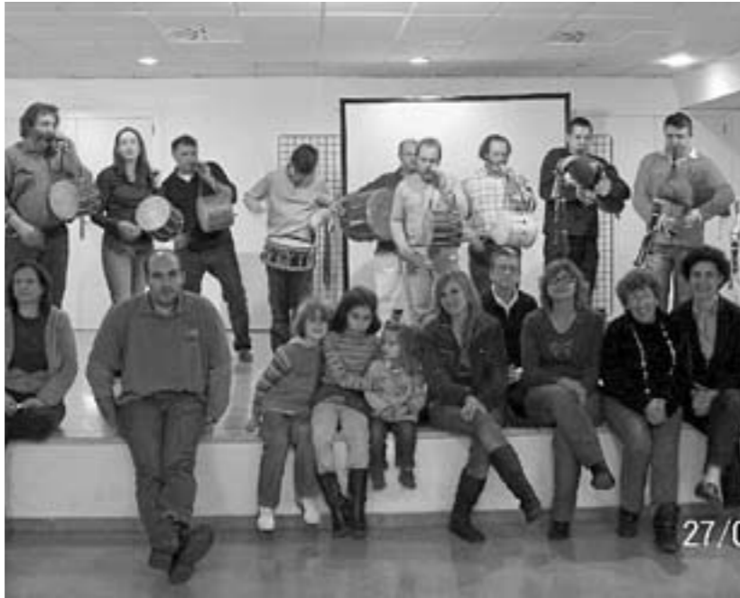
Familiars i xeremiers gaudiren de la trobada

L'ajuntament ens va deixar el Centre de dia, cada un va dur menjar fet a casa i una botella de vi... menjarem un menú de dotze plats, beguérem i tocarem i tocarem... férem balanç de lo que hem fet i lo que volem fer en el futur, de cada vegada es senten més les xeremies a Esporles, ara també volem arribar a Banyalbufar i Valldemossa; animam a que s'apunti més gent, no ho podeu tenir mai més bé, per una banda l'Escola de Música que vos ensenyarà a tocar el flabiol, el tamborí i la xeremia, per l'altre els Xeremiers d'Esporles que vos faran tocar i tocar al poble. Esperem que l'any qui ve la foto sigui amb més gent.