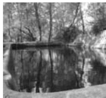
Safreig de Bellavista