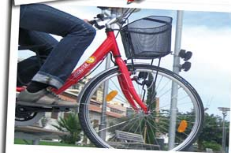
Bicicleta Pública Mou-teB