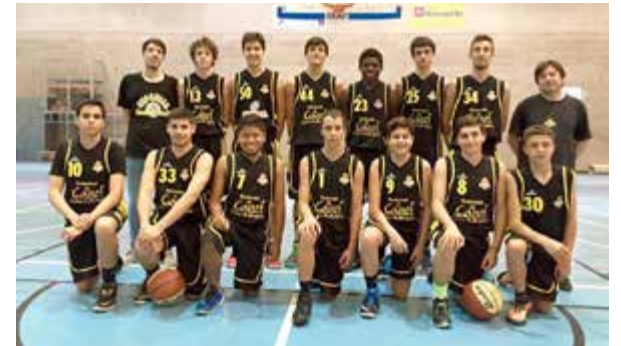
Final junior masculí

No podem acabar, sense fer una referència als nostres equips de formació, que enguany han crescut amb les