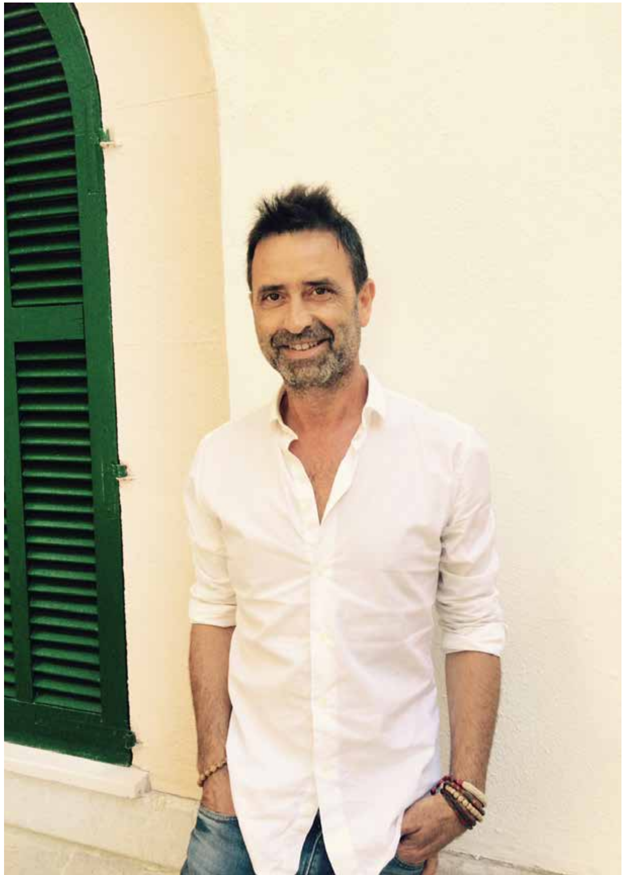
“Tenc molta energia i necessit treballar amb les mans”

Ho vaig passar molt malament durant 20 anys. Anava a apagar un foc i me telefonaven que havien tengut un cop amb el cotxe.