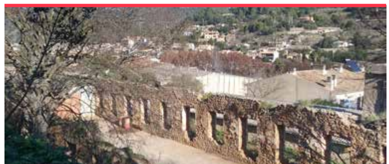
Fàbrica de Can Ribes